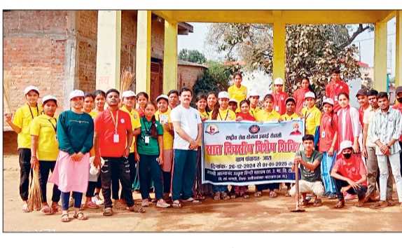
हरिभूमि न्यूज ► पलारी