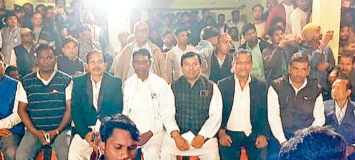
हरिभूमि न्यूज ► गिधौरी