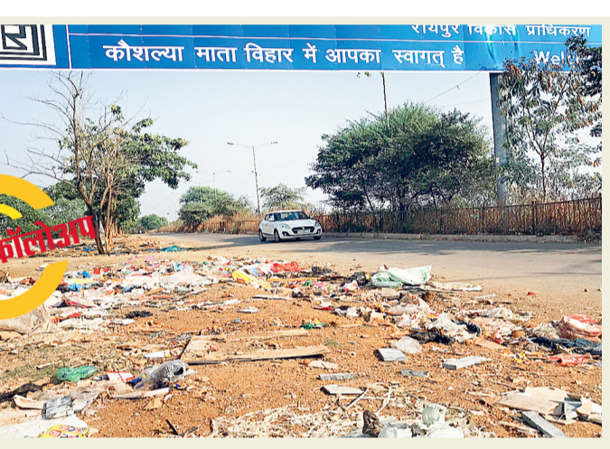
कौशल्या विहार के रहवासी परेशान, स्ट्रीट लाइट बंद, कूड़ा-करकट, सुरक्षा की समस्या

हरिभूमि न्यूज ▶▶ रायपुर आरडीए और छत्तीसगढ़ गृह निर्माण मंडल की दर्जनभर कालोनियों को नगर निगम हैडओवर नहीं ले रहा है। इन कालोनियों को निगम में हैडओवर लेने पूर्ववर्ती कांग्रेस सरकार के समय बाकायदा निर्देश भी जारी हुए, इसके बाद भी निगम प्रशासन ध्यान नहीं दे रहा। विडंबना ये है कि, कालोनी के रहवासी नगर निगम को प्रापर्टी टैक्स के साथ जल कर का भुगतान हर साल कर रहे हैं, पर नगर निगम की ओर से उन्हें डोर डोर कचरा कलेक्शन, नाली व सड़क की सफाई सहित अन्य मूलभूत सुविधा अब तक नहीं मिल पाई। उल्टे कौशल्या विहार सेक्टर 4 के रहवासी एरिया में निगम ने कचरा प्राइमरी डंप करवाना शुरू कर दिया है। इससे रहवासी बेहद ज़रत हैं। दरअसल, रायपुर विकास प्राधिकरण के 1200 करोड़ के आधा दर्जन प्रोजेक्ट को नगर निगम ने हैडओवर नहीं लिया है। दोनों महकमे के अधिकारियों की संयुक्त टीम ने सर्वे कर अपनी जांच रिपोर्ट पहले ही सौंप दी है। जोन 10 कमिश्नरी ने इसके बाद 125 करोड़ का डिमांड नोट भेजा है। प्राधिकरण के अधिकारियों का कहना है, हम पैसा नहीं दे सकते, बल्कि खामियां पूरी कर देंगे। इसी तरह इंद्रप्रस्थ रायपुरा