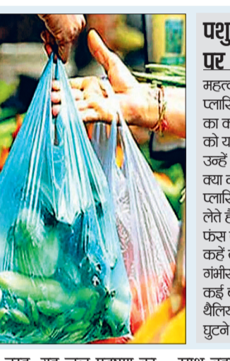
इसी तरह, यह जल प्रदूषण का भी कारण बनता है। लोग लापरवाही से सड़कों, नालों और नदियों में बैग फेंक देते हैं, जिससे वे जल निकायों में चले जाते हैं। हवाएं उन्हें अपने

प्लास्टिक बैग को नकारने के कई कारण हैं। हमें अपने पर्यावरण को बेहतर बनाने और इसे क्षरण से बचाने के लिए इनका उपयोग बंद कर देना चाहिए। प्लास्टिक बैग के उपयोग को रोकने के लिए कई पर्यावरण-अनुकूल विकल्प हैं जिनका उपयोग किया जा सकता है। सबसे पहले, प्लास्टिक बैग प्लास्टिक प्रदूषण का एक प्रमुख स्रोत हैं। चूकित वे गैर-बायोडिग्रेडेबल हैं, इसलिए उन्हें विघटित होने में कई साल लगते हैं। वे बहुत सारे कचरे का योगदान करते हैं जो वर्षों तक इकट्ठा होता रहता है।